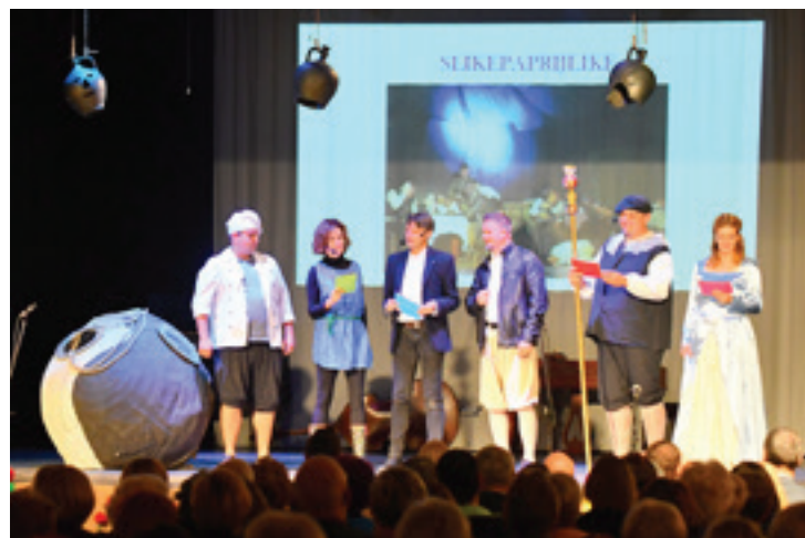
Gledališka sekcija Slikepaprijlike