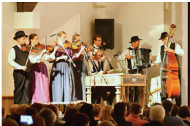
Glasbeniki FS Beltinci