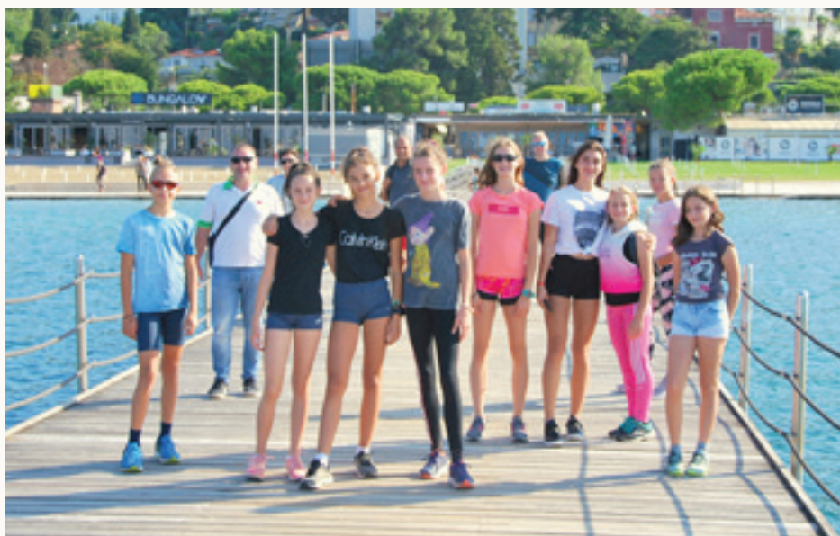
Atletinje ŠD Sloparca

Atletinje naše občine in ŠD Sloparca so se v zadnjem času udeležile kar nekaj tekmovanj na mednarodni, državni