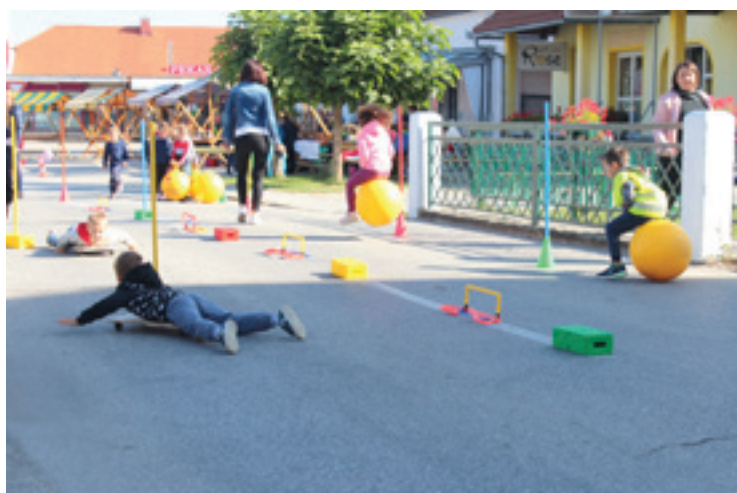
ETM - Dan brez avtomobila 2019 - Gibalni poligon