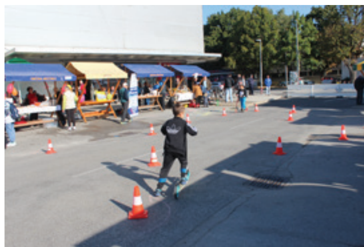
ETM - Dan brez avtomobila 2019 - Spretnostna vožnja