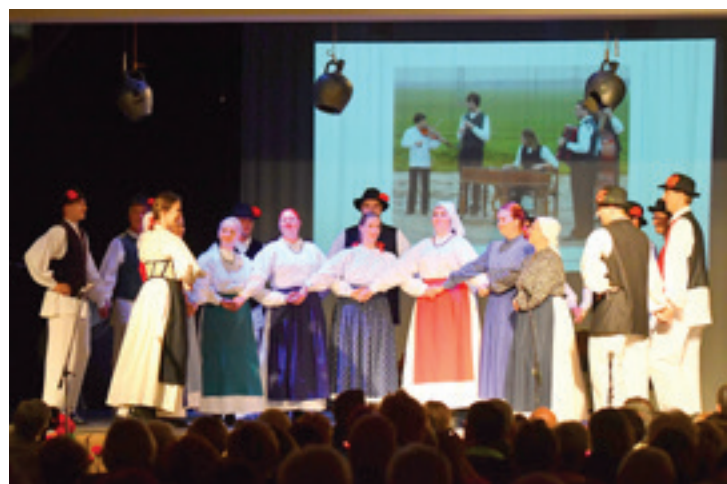
Članska FS Beltinci