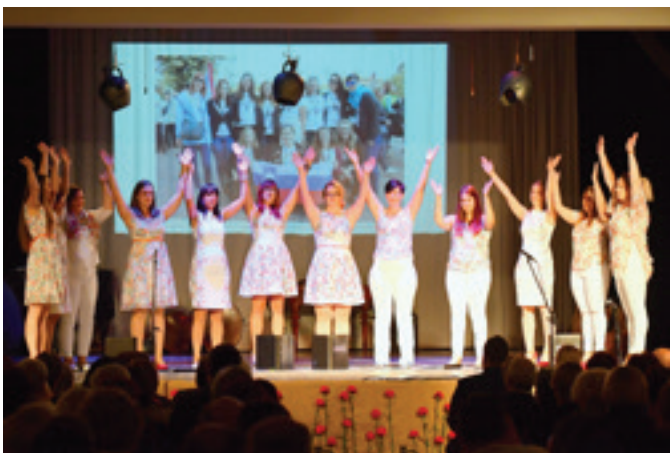
Vokalna skupina BeleTinke