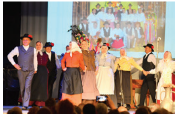
Veteranska FS Beltinci