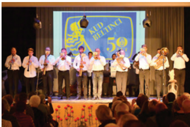
Plej banda Beltinci