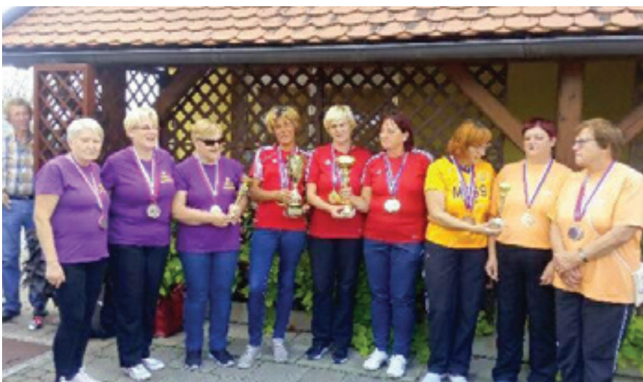
Na fotografiji zmagovalke v rdečih majčkah

Medobčinsko društvo slepih in slabovidnih Murska Sobota je bilo v soboto, 31. 8. 2019, v Športno-