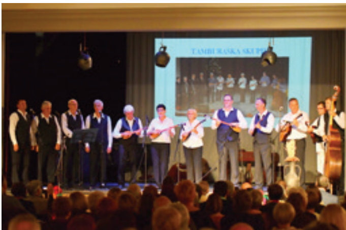
Tamburaška skupina KUD Beltinci